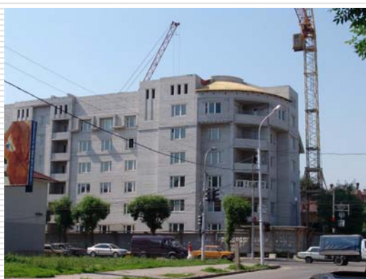
□ Июль 2006