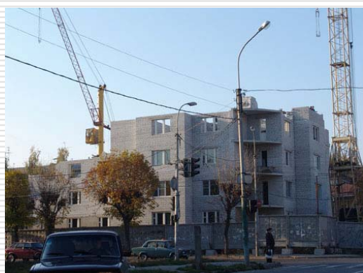
□ Сентябрь 2005