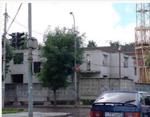
□ Июль 2005