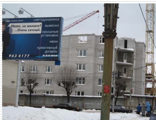
□ Декабрь 2005